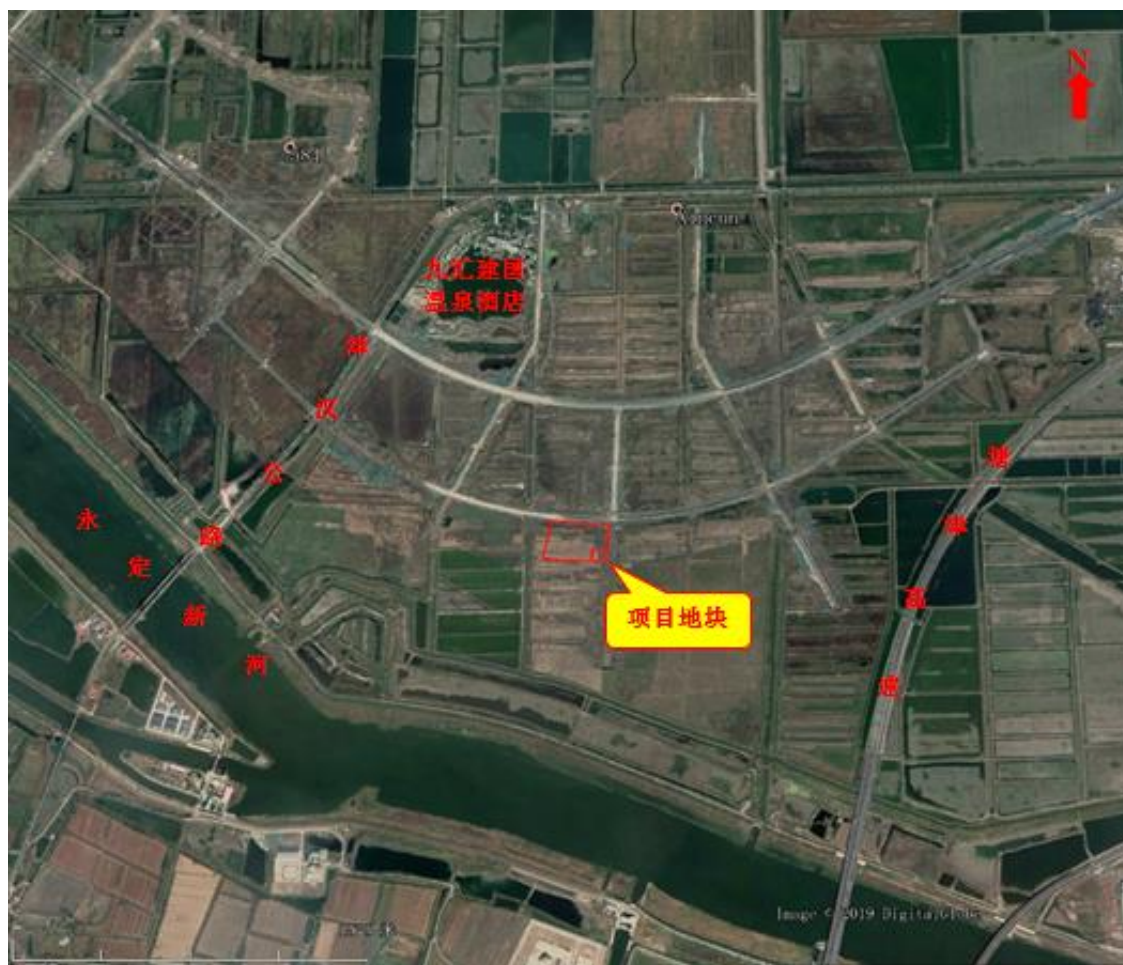
图 1.1-1 场地交通位置示意图

地块地理位置示意图见图 1.1-1，调查地块边界拐点坐标见表 1.1，地块调查范围见图 1.1-2。